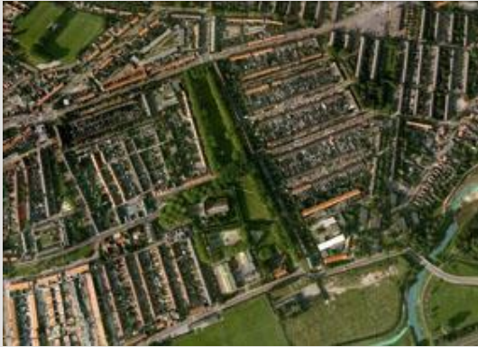
Luchtfoto van de wijk Heuvel te Breda met groene brink en kerk centraal in de wijk.

De Van Hogendorpstraat is een rustige woonstraat in de wijk Heuvel te Breda. De wijk, ontworpen door stedenbouwkundige Grandpré Molière, is in de jaren vijftig opgezet volgens de zogenaamde Delftse School. Dit is een stroming waarbij traditionalisme een tegenwicht bood aan de Nieuwe Zakelijkheid. De opzet van de woonwijk is gebaseerd op de structuur van een dorp. Centraal in de wijk ligt een plein (Mgr. Nolensplein) met kerk, pastorie, dokterspraktijk en winkels. Aansluitend daaraan is een grote groene ruimte gemaakt, de Heuvelbrink, met daaromheen de woonstraten.