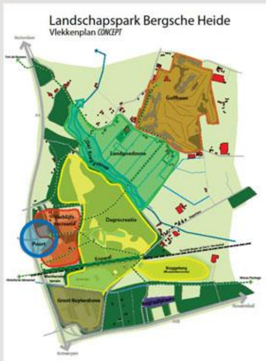
Vlekkenplan voor Landschapspark Bergsche Heide.