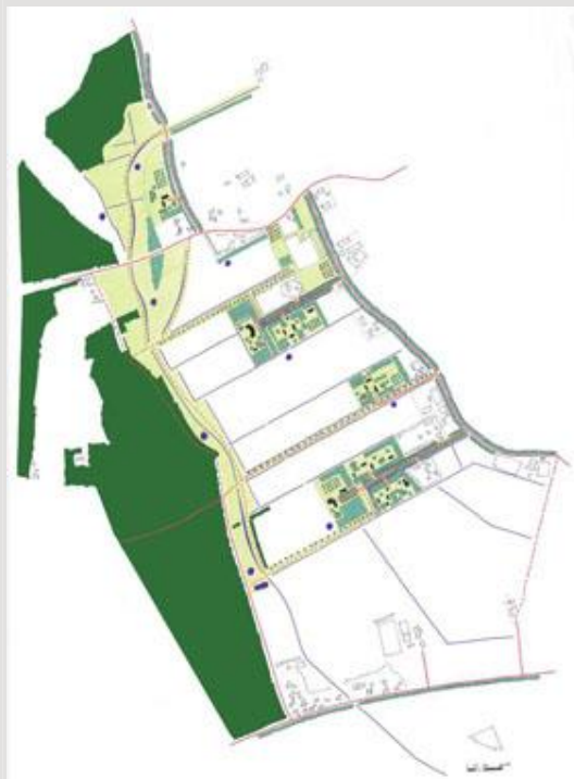
Schets voor de landgoedzone met geclusterde verzamelerven.

Om tot een visie te komen voor de ontwikkeling van een landgoedzone heeft Plancompagnons eerst een inventarisatie en analyse gemaakt van de bestaande situatie. Er is een visie uitgewerkt die als basis zal dienen voor de verdere ontwikkeling. In deze visie spelen historie, ecologie, visueel-ruimtelijke en functionele aspecten een belangrijke rol. Uiteraard komen ook de