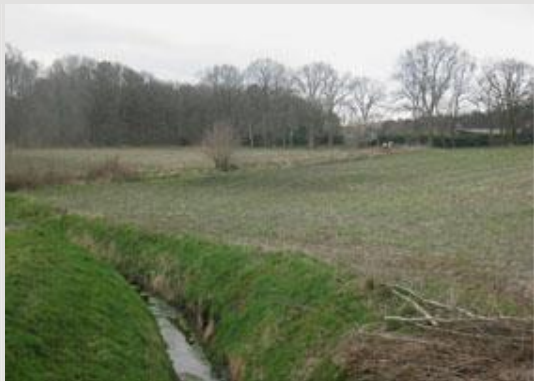
Situatie van de Kraggeloop, 2014.

maatschappelijke kanten van deze locatie aan de orde.