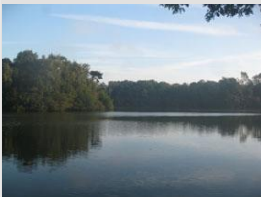
Plas De Zanderijen in het zuidelijk deel van Landschapspark Bergsche Heide.