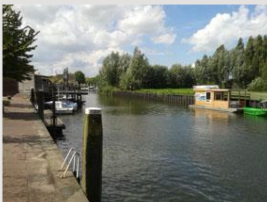
Voormalig Degaterrein aan de haven van Lage Zwaluwe.