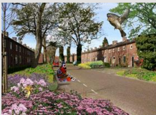
Impressie van de straat na de uitvoerde

onkruidvrij wordt gemaakt en voorzien van een goede teelaarde, sluit de beplanting zich snel. Een juiste samenstelling van het assortiment met sterke soorten en een juiste bodemopbouw van de ondergrond zorgen voor een bestendige groei.