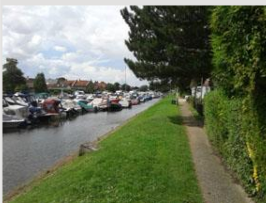
Jachthaven met wandelpad.