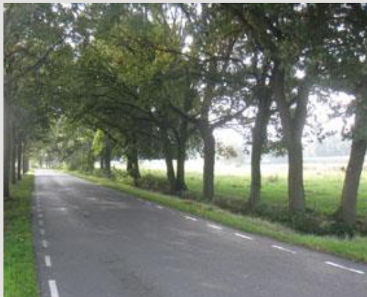
Schansbaan begeleidt door bomen.

Landschapspark Bergsche Heide is circa 460 hectare groot en globaal gezien begrensd door de snelwegen A4 en A58 aan de west en zuidzijde. Aan de noord en oostzijde loopt het gebied door tot aan de nieuw te ontwikkelen Golfbaan De Bergsche Heide en Moerstraatsebaan/Schansbaan.