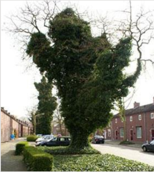
Uit de kluiten gewassen klimop in de witbloeiende acacia.

De Van Hogendorpstraat is één van die woonstraten waar zorgvuldig over het groen is nagedacht. In de jaren zestig en zeventig is het groen in de woonstraten verminderd door het toevoegen van parkeerplaatsen. Desondanks is er in de huidige situatie een groen straatbeeld aanwezig. De witbloeiende acacia's zijn volwassen bomen geworden die de groenstructuur van de straat bepalen. De oorspronkelijke haagstructuur van liguster is nog intact.