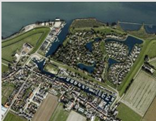
Haven van Lage Zwaluwe.