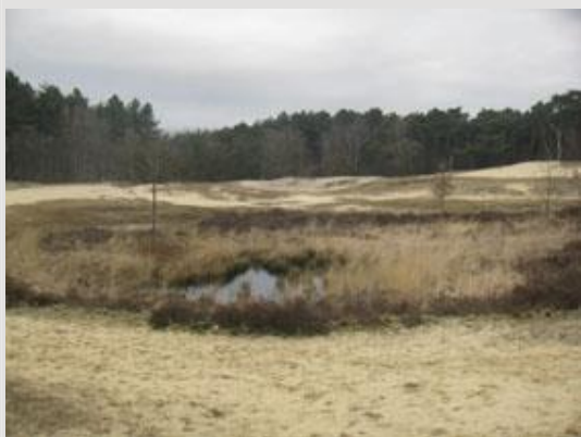
Gevarieerd landschap in Landschapspark Bergsche Heide: Stuifzand met heide en ven.