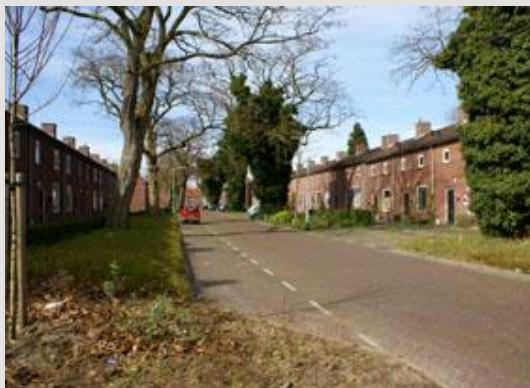
Bestande situatie in de Van Hogendorpstraat in 2014