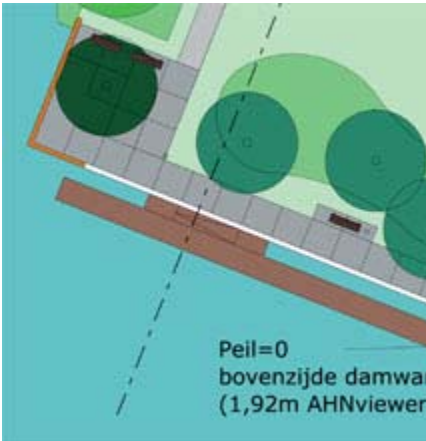
Zitplek op de kop van het terrein, aan het eind van de boulevard en drijvende steigers.