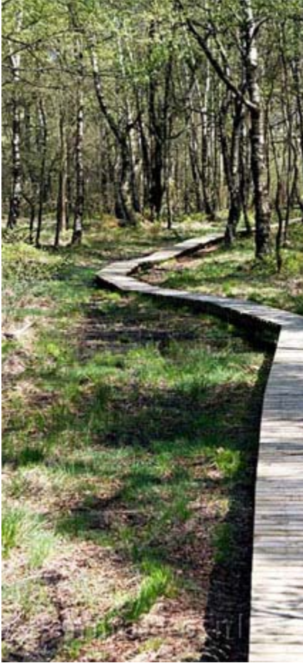
Referentiebeeld van vlonderpad door drassig deel van het terrein.