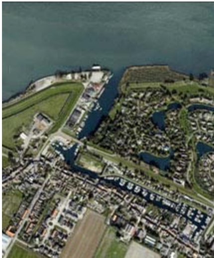
Luchtfoto haven Lage Zwaluwe.

Door het aanleggen van een "wandelpad" rondom een multifunctioneel te gebruiken grasveld worden de gebruiksmogelijkheden vergroot. Aan de oostzijde, nabij de aanlegsteiger van de veerboot naar de Biesbosch, zijn picknicktafels en een fietsenstalling voorzien als uitwerking van een Toeristische Overstap Plaats (TOP). Het wandelpad bestaat uit verschillende delen zoals half verharde paden, de boulevard langs het water, het vlonderpad door een drassig en bebost gedeelte van het terrein en tot slot de trap op de helling van de dijk. Hier sluit het wandelpad aan op het wandelpad langs de noordelijk gelegen woonwijk.