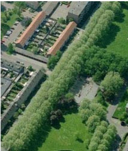
Luchtfoto Twikkelstraat in de wijk IJpelaar te Breda.

De Amarant Groep uit Tilburg heeft Van Beijsterveldt & Gommers architecten gevraagd een ontwerp te maken voor een woon/zorgcomplex. Het gebouw moet komen op de plaats van een voormalig schoolgebouw in de wijk IJpelaar aan de Twikkelstraat te Breda.