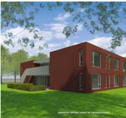
Impressie woon/zorgcomplex door van Beijsterveldt & Gommers architecten.