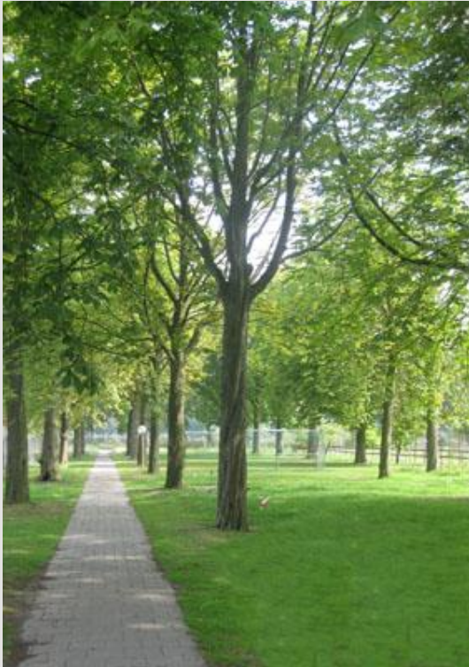
Situatie van de laan met Paardenkastanjes in 2013.

In opdracht van ASVZ wordt gewerkt aan het uitwerken van een beplantingsplan voor het terrein Vincentius te Udenhout. Op het terrein worden negen twee-onder-één-kapwoningen gebouwd en vier kwadrantwoningen. Het gaat om woningen voor begeleid wonen in groepsverband. Door deze bouwactiviteiten wordt het terrein aangepast, de ontsluiting verbeterd en de beplanting bijgewerkt.