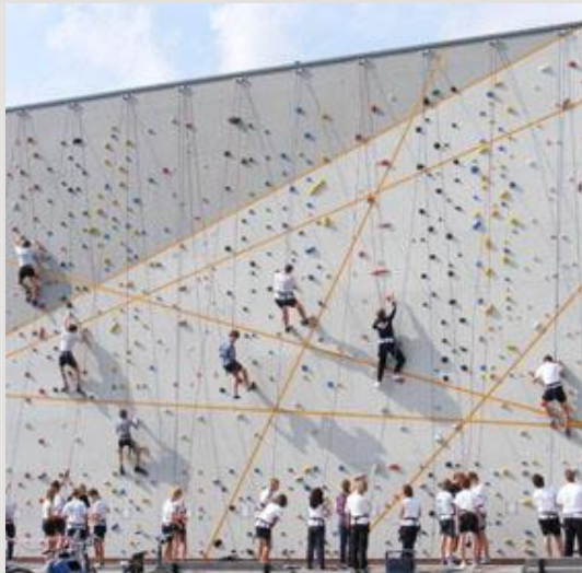
De bestaande klimwand op het schoolplein blijft zijn prominente plaats houden.

Omdat het komen en gaan van scholieren en het schoolpersoneel zich vooral en massaal voordoet in de fietsenstalling, is deze ruim en overzichtelijk opgezet. Vanuit één zijde is de fietsenstalling te benaderen. Via brede paden