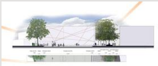
Doorsnede schoolplein met verlaagd sportveld.