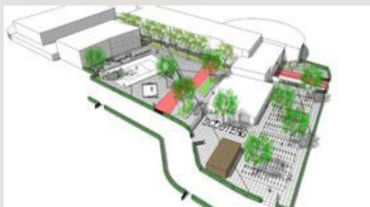
Vogelvluhtimpresie voorlopig ontwerp schoolplein.